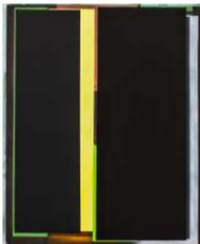
O.T., (WV22, Lw47), 2022, Acryl auf Leinwand, 160x130cm

Abdruck honorarfrei unter Angabe der Bildquelle: