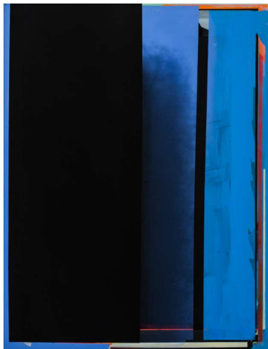
O.T., (WV23, Lw27), 2023, Acryl auf Leinwand, 130x100cm